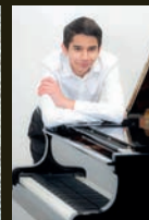
Constant Despres © National Mejug