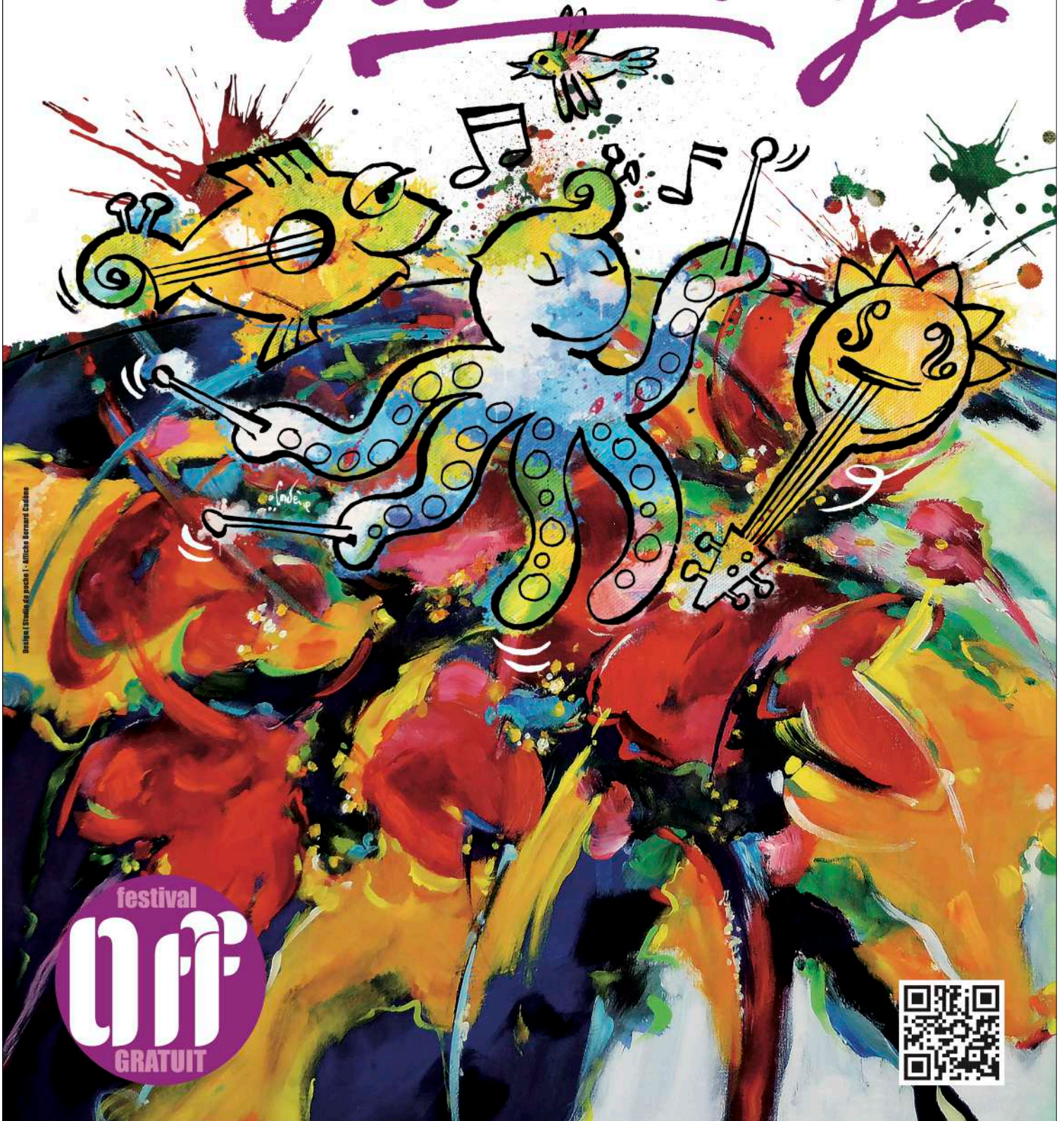
Illustration: Studio de pacas - Nicolas Barnaud Gaudens